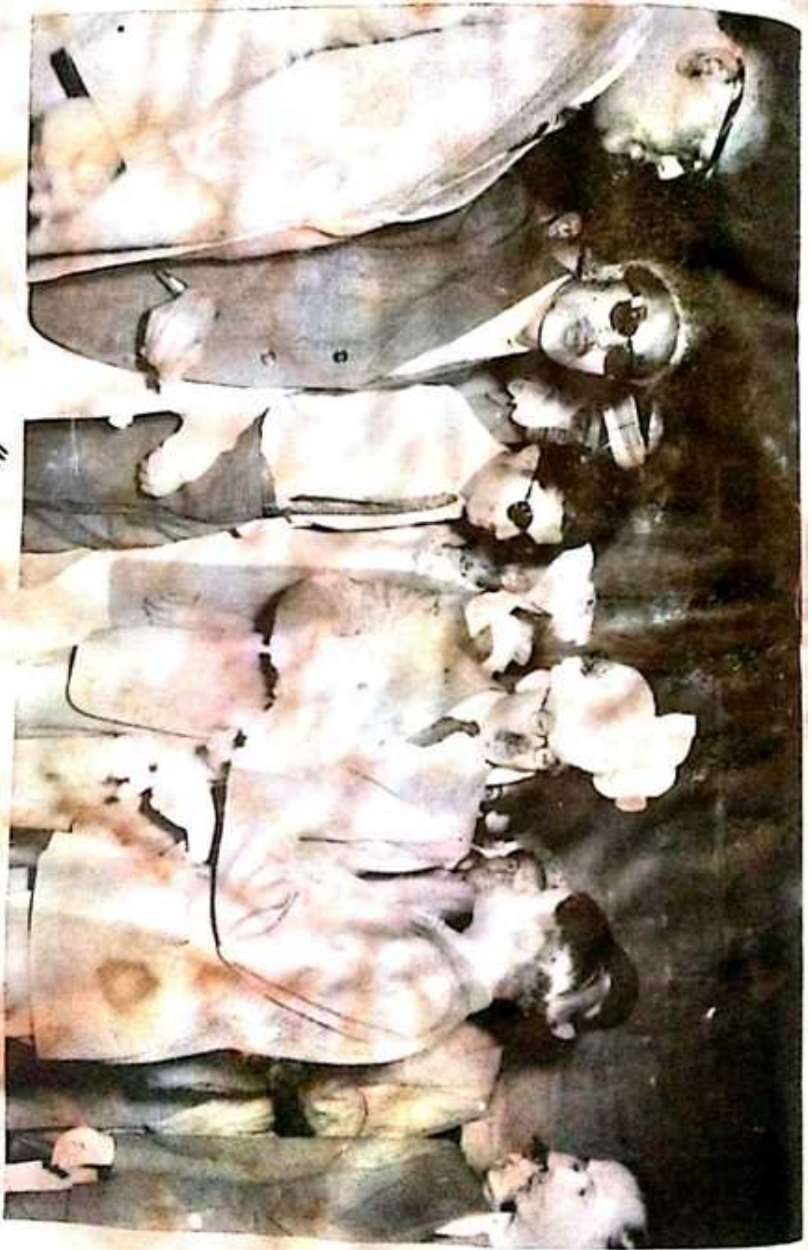
سزائی پشمیو کا رجاہیہ - میر غلام محمد شاہ ہوائی گون بلوچستان پر ایجنٹ ٹو گورنر جنرل خالق قربان علی خان بٹ اور شتا بگ