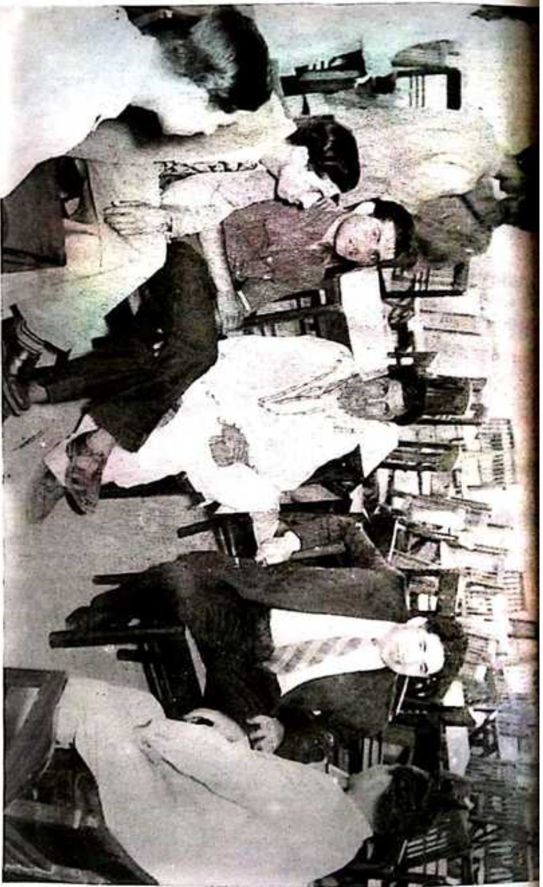
میر غلام محمد رشید ہوائی بیٹری روپیچ و گول ایڈائی تو فصل جنرل۔ آئی کشی محمود احمد نمائندہ ڈان شمس الحق خان نمائندہ ڈان نمبر آف پاکستان