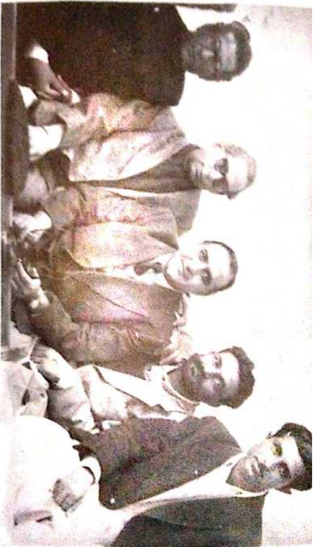
میر غلام محمد شاہ ہوائی . شہر کراچی . بوئینگ بیڑھا راق سید سیدما و ظہیر و عاصم ملک