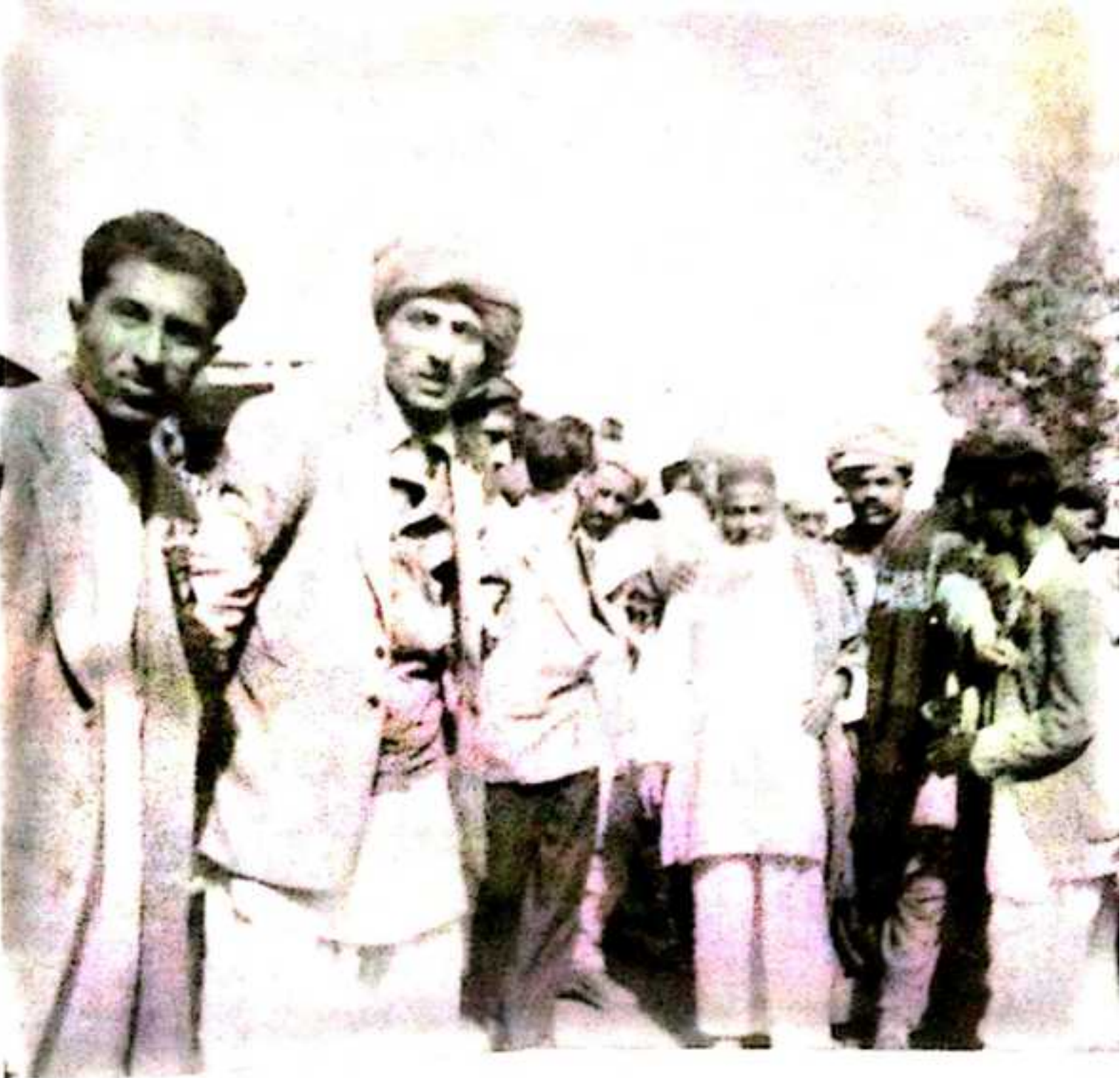
روچ در مکی پاکستان ۶ سروس . مولانا عبدالحمید خان بھاشانی کو مٹا گوں میر غلام محمد شاہوانی ۶ اوشتاہگ .