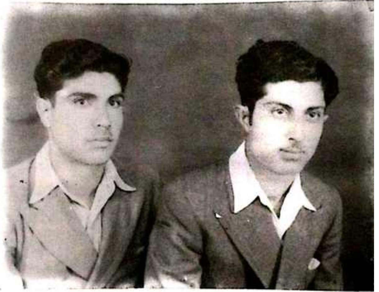
لارغلام محمد شاهوانی گون و قی ناکو (ماما) محمد حیات عمر