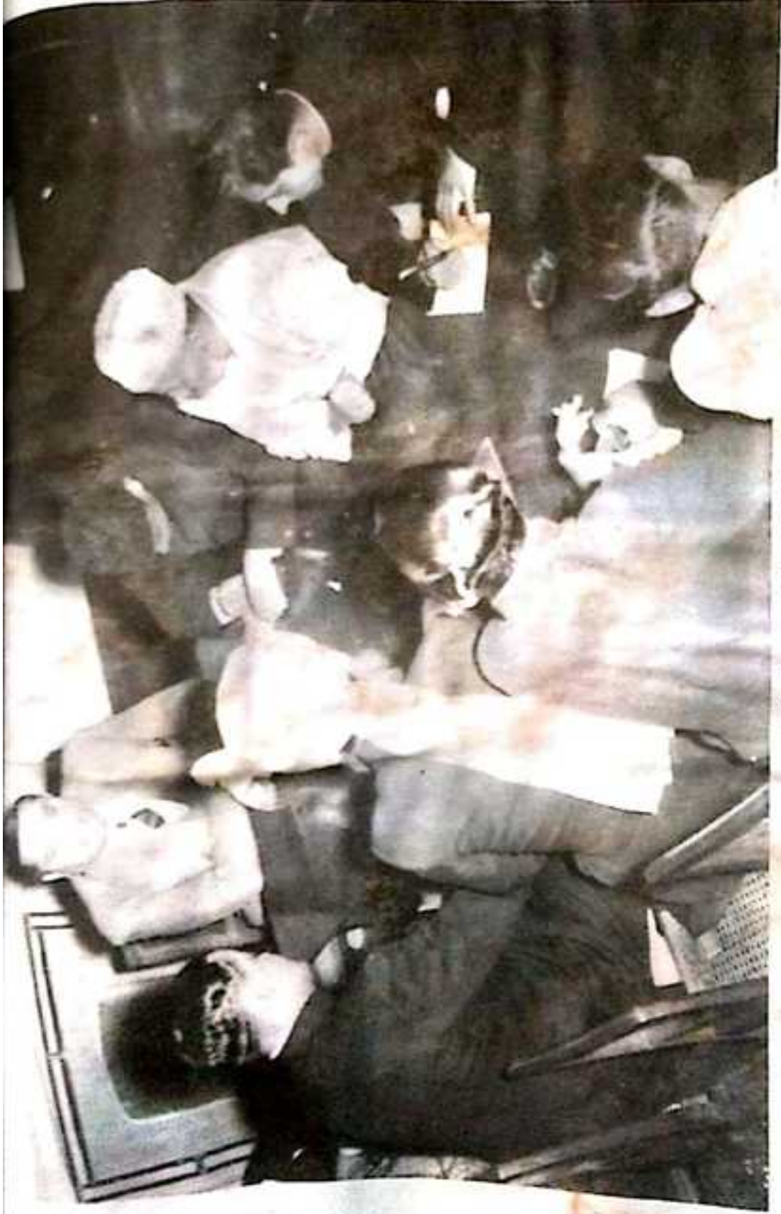
بلوچستان ای آئی اے سردار بہادر خان پیریس کا نفرس ء تنظیم ء اید میٹر محمد کن نظامی و میر غلام محمد شتا ہولانی اولی ایس صرف ء قاضی نور الحق تماندہ پاکستان ٹائمز مولانا عبداللہ اید میر پاسبان او محمود احمد نمائندہ ڈان، واجہ پریچر مینٹ