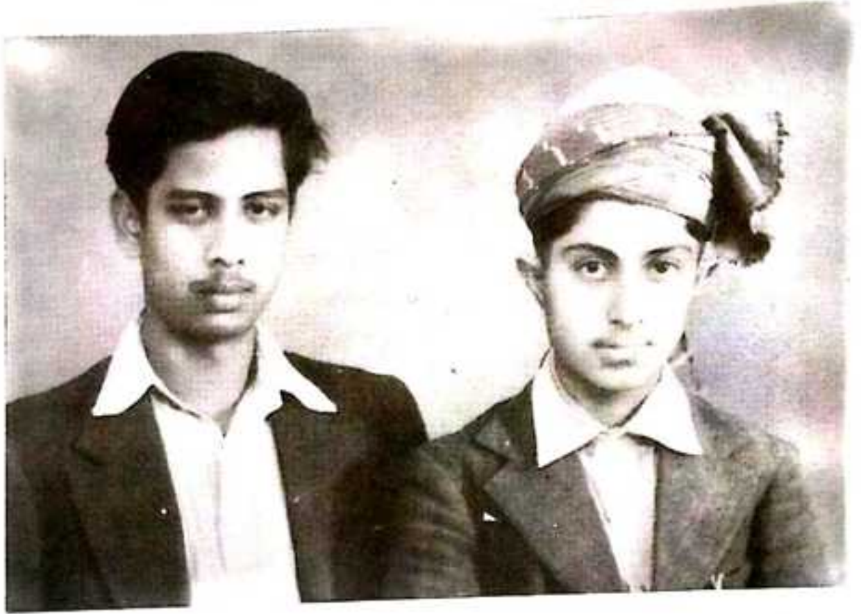
لالہ غلام محمد شاہوانی گوں وقتی سٹنٹ منوراً