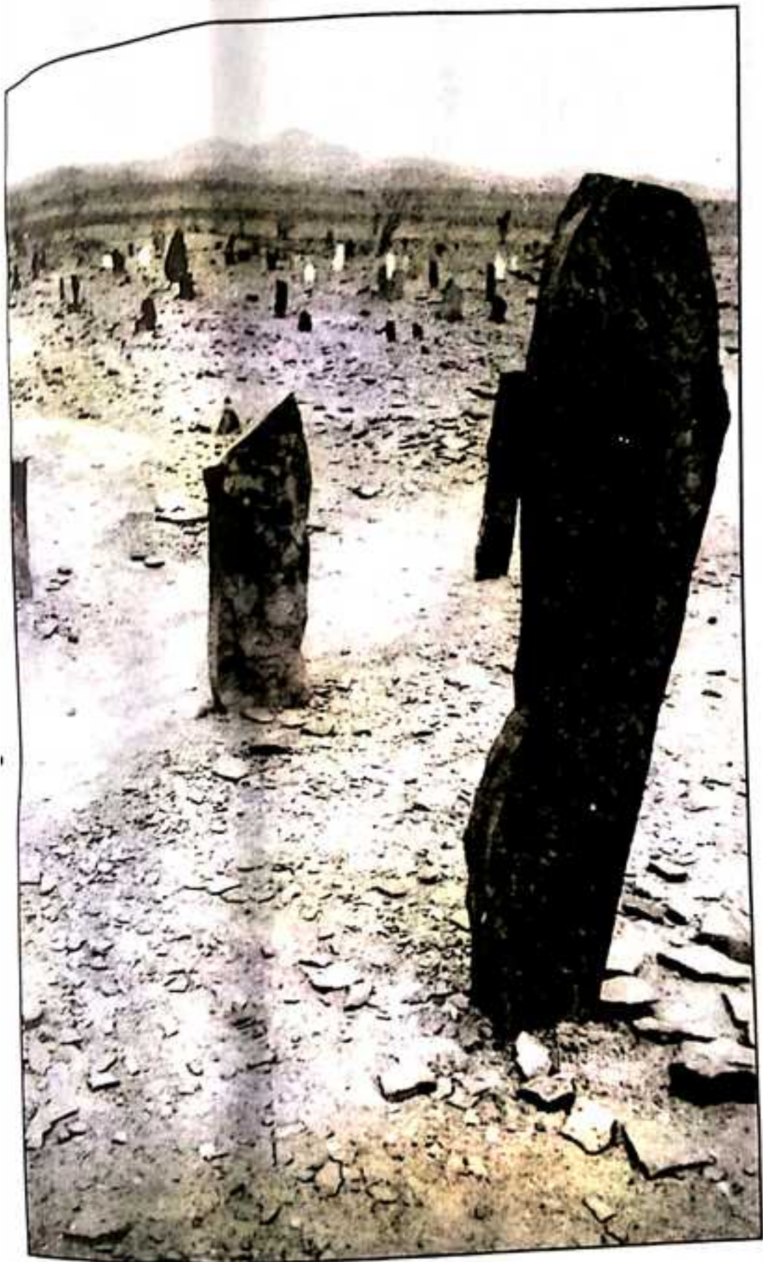
مان پيرانلدر كولواه ء گوهرام پيرء گورستان ء سردار عبدالكریم ميروازی ء گندی واپ جاه.